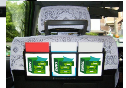
※ケースは2種類(指定はできません)