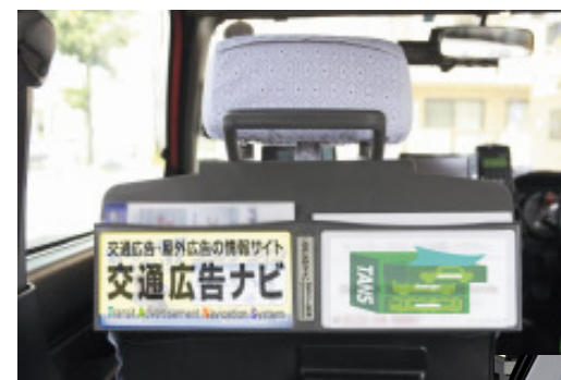
※東京エリア掲出イメージ

指定日までに弊社指定場所(東京都内)へ一括納品願います。 納品物には、弊社で事前に発行する広告物管理ラベルを貼り付けていただきます。